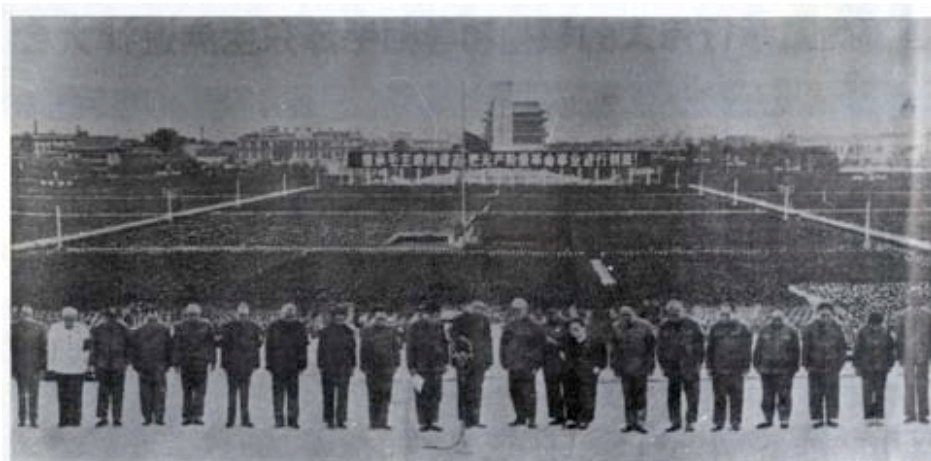
1976年9月18日北京天安門廣場追悼毛澤東逝世大會，站在第一排者是黨和國家領導人：蘇紹華、陳永貴、李國清、吳德、紀登奎、李先念、江青、張春橋、王洪文、華國鋒、葉劍英、宋慶齡、姚文元、陳錫聯、江東興、許世友、李德生、吳桂賢、倪志福（人民日報1976年9月19日）。