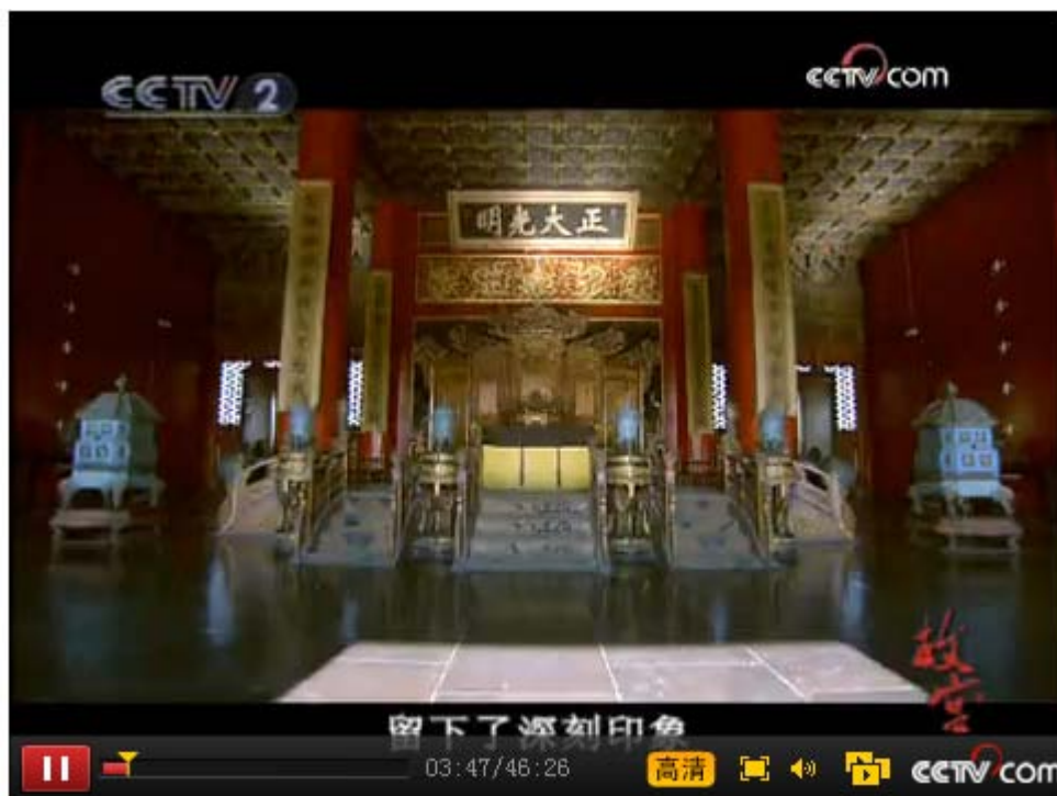
图 2:《故宫》第 2 集《故宫藏玉》

上述两个画面的构成都运用了反射在匾额上的阳光，它们分别出现在电视纪录片《故宫》的不同段落中。前者见第 3 集《礼仪天下》，摄影师采用特殊的拍摄方法记录了一年中太和殿最难得一见的景观：冬至这天，阳光可以反射到大殿正中的匾额上，自然变化与人类创造结合而成的奇特景象被忠实地记录下来，能指以消极修辞的方式被运用，起到的是再现事实的作用；后者见于第 8 集《故宫藏玉》，英国使节参观故宫宫殿的段落，强化阳光在匾额上的反射，目的不是为了强调罕见景观，而是为了表现宫殿在英国人眼中的富丽堂皇，能指以积极修辞的方式被运用，起到的是表现情感的作用。